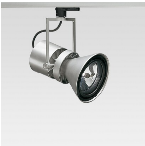
Le Perroquet - Projecteur avec transformateur électronique à variation 75 W QR 111